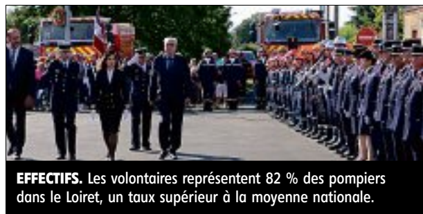
EFFECTIFS. Les volontaires représentent 82 % des pompiers dans le Loiret, un taux supérieur à la moyenne nationale.

Le 125 e congrès départemental des sapeurs-pompiers s'est déroulé samedi, à Ouzouer-sur-Loire.